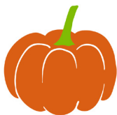
buča hokai- do